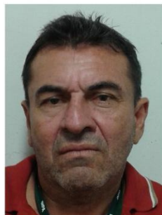
João F. da S. Neto Prefeitura / COATL Ramal 1934