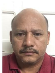
Hélio C. Vilas Boas/ G. Pesquisa com Abelhas COBIO Ramal 3281