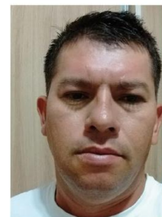
Jean Carlos A. da Silva Reserva Adolpho Ducke DISER / COATL Ramal 3252