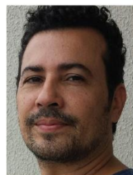
Tito Lívio do N. Fernandes Editora / COAES Ramal 3030