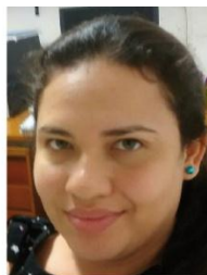
Aretusa Cetauro de Abreu Lab. Química Ambiental CODAM Ramal 3165