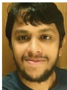
Leonardo R. Oliveira Prédio da LBA COATL Ramal 3238