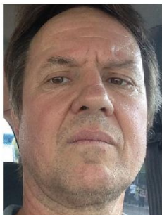
Alexandre Honczaryk Lab. Reprod. Peixes COTEI Ramal 1883