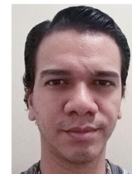
Rodrigo P. Verçosa Editora / COAES Ramal 3030