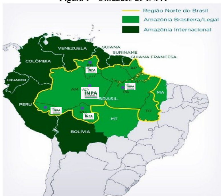
Figura 1 - Unidades do INPA